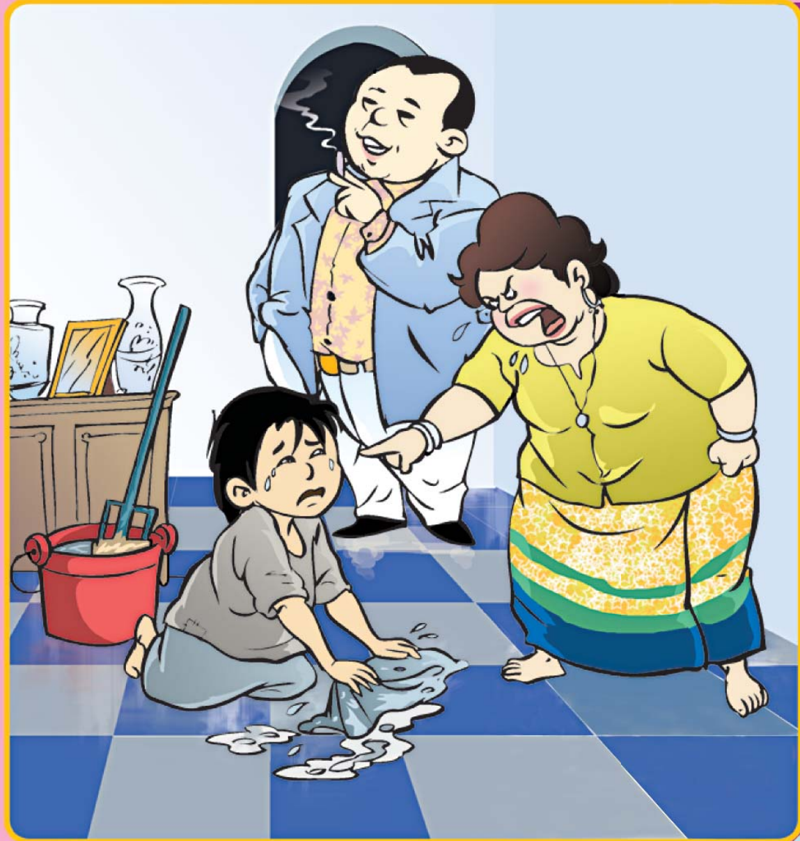
មិនត្រូវលាក់បាំងរឿងនេះទេ ត្រូវរាយការណ៍ទៅអាជ្ញាធរ ឬអង្គការពាក់ព័ន្ធ