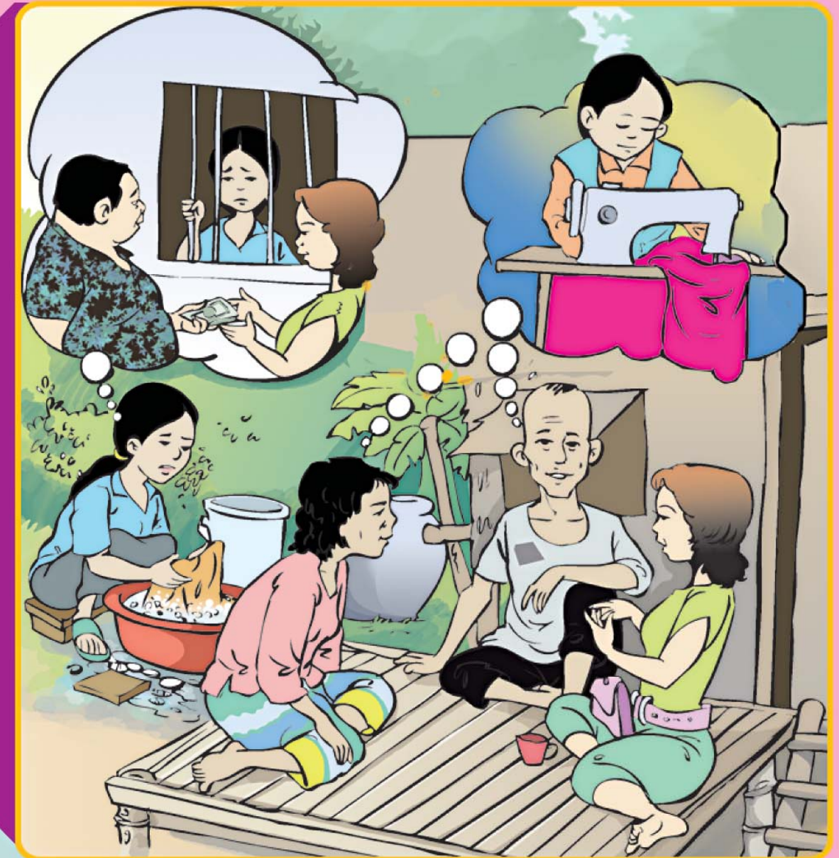
ត្រូវពិចារណាសិន មុននឹងសម្រេចចិត្ត