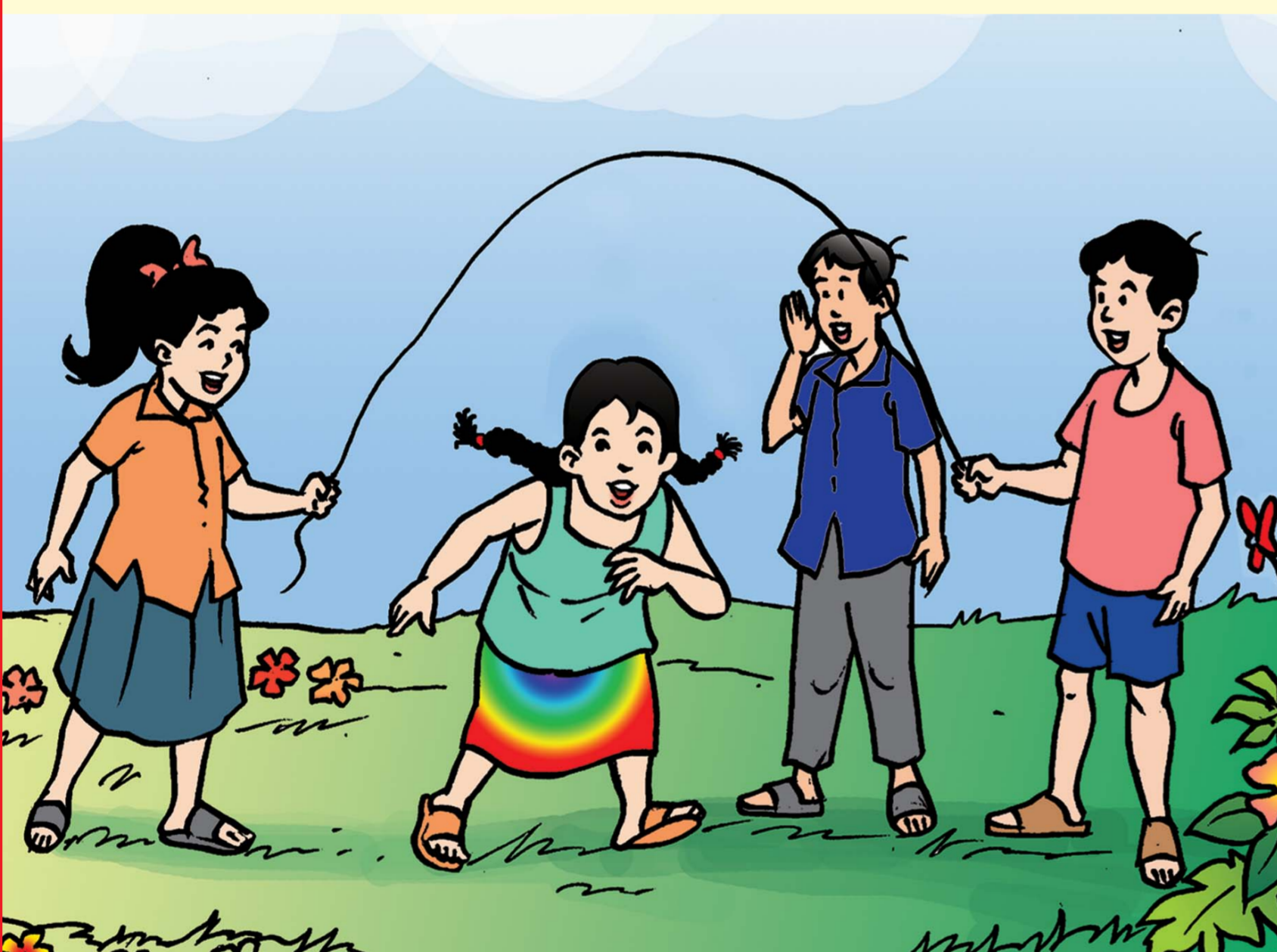
កុមារមានសិទ្ធិលេងកម្សាន្ត និងលំហែ