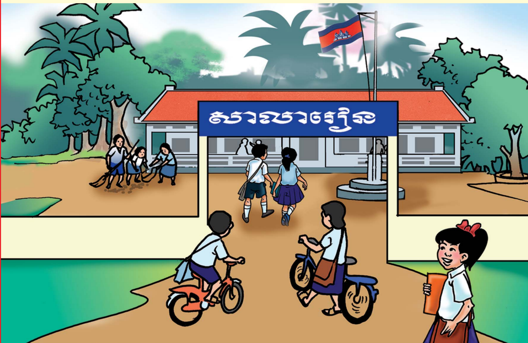
កុមារមានសិទ្ធិទទួលបានការអប់រំណាទូទៅ និងក្រៅប្រព័ន្ធ