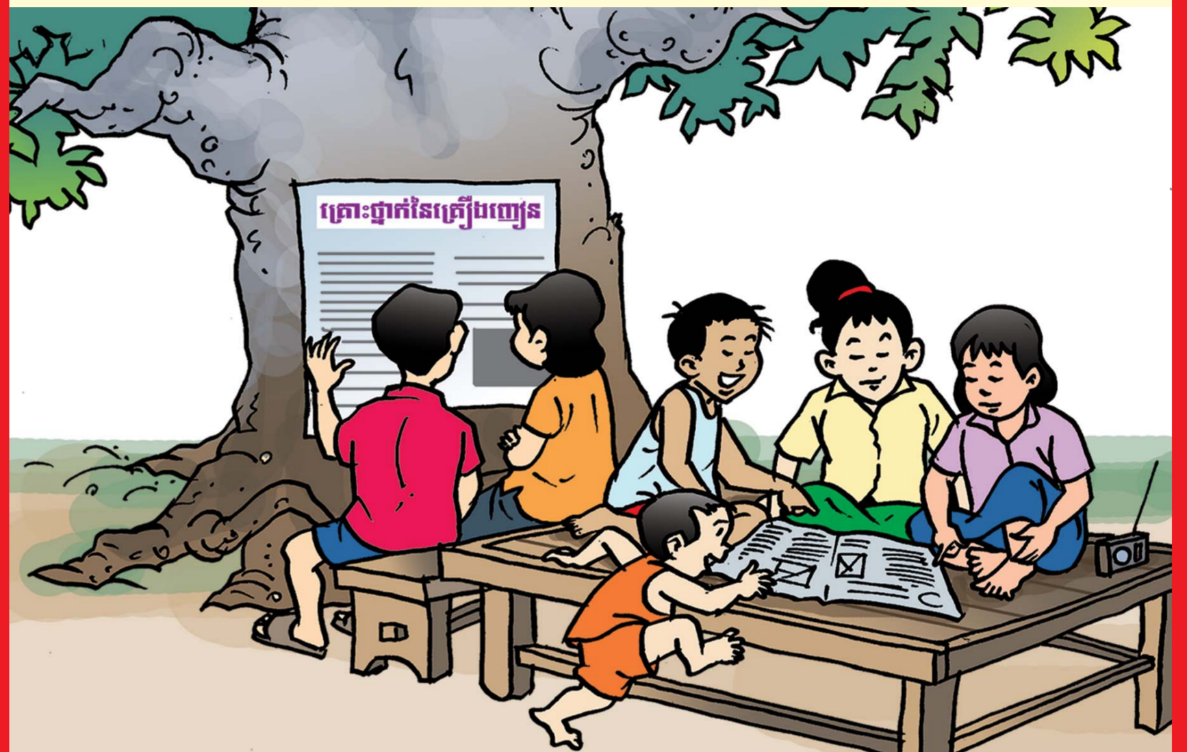
កុមារមានសិទ្ធិទទួលបានព័ត៌មានសមស្រប