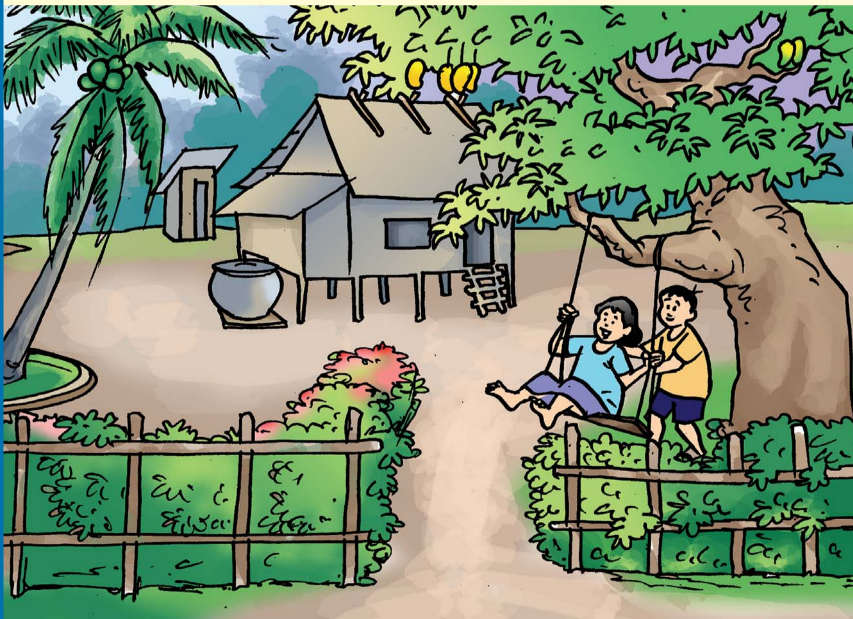
កុមារមានសិទ្ធិមានសម្រាកសមរម្យ