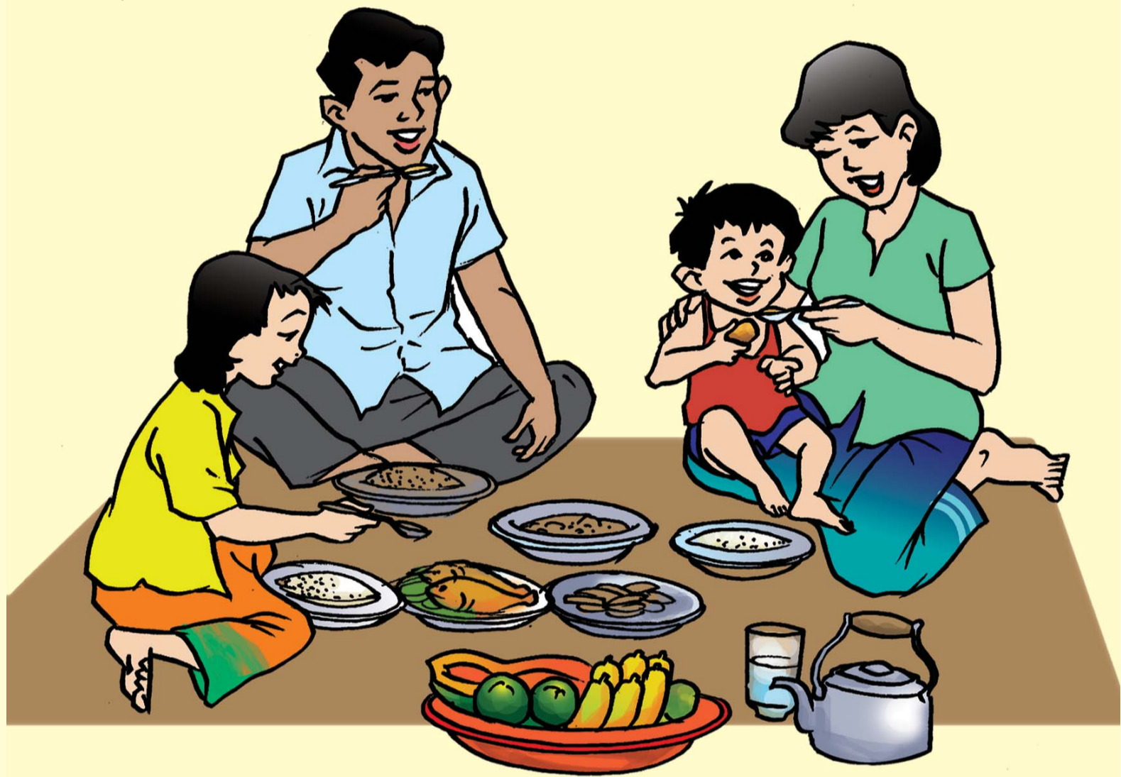
កុមារមានសិទ្ធិទទួលបានចំណីអាហារគ្រប់គ្រាន់