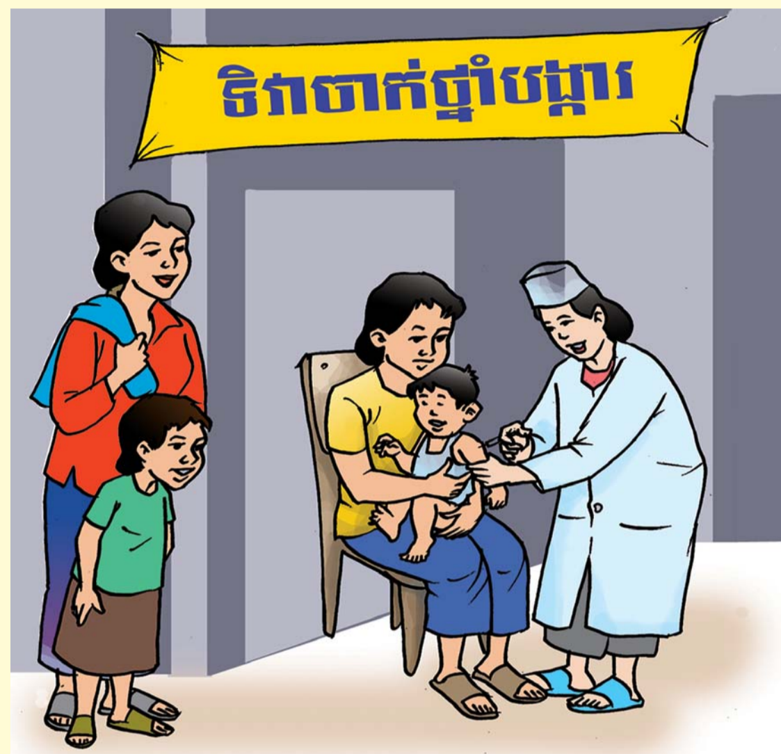
កុមារមានសិទ្ធិទទួលបានការព្យាបាល និងថែទាំសុខភាព